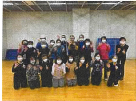
小田原大井町の方々