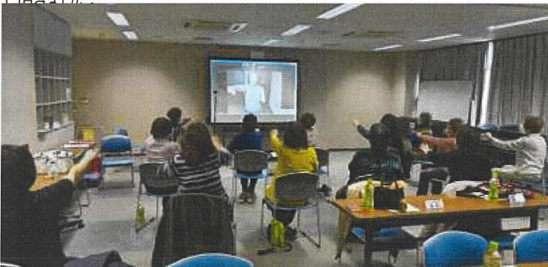
座間市老人クラブ連合会様とのオンラインレッスン(奥のスクリーンに僕が映っています)

・神奈川県政策局 いのち・未来戦略本部室コミュニティ活性化グループ「コミュニティ再生・活性化モデル事業(第2期)」として https://www.pref.kanagawa.jp/docs/k8d/community/model2.html 2022.02.25 に座間市老人クラブ連合会様とオンラインレッスンを開催致しました。連合会の代表者が集まる会議の中で1時間程「脳トレリズム体操」を行いコロナ禍での運動不足解消とオンラインツールを使った新しい運動のあり方を体験して頂きました。