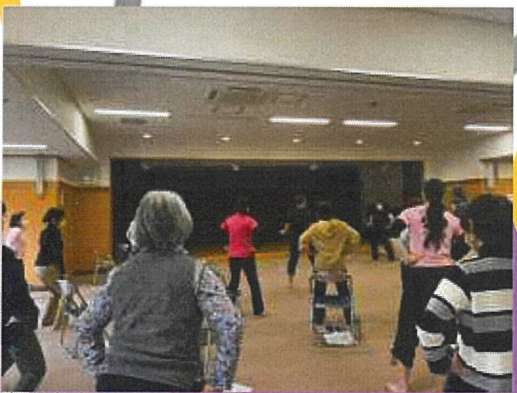
海老名市でのレッスン風景