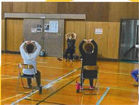
西湘スポーツセンターでのレッスン風景